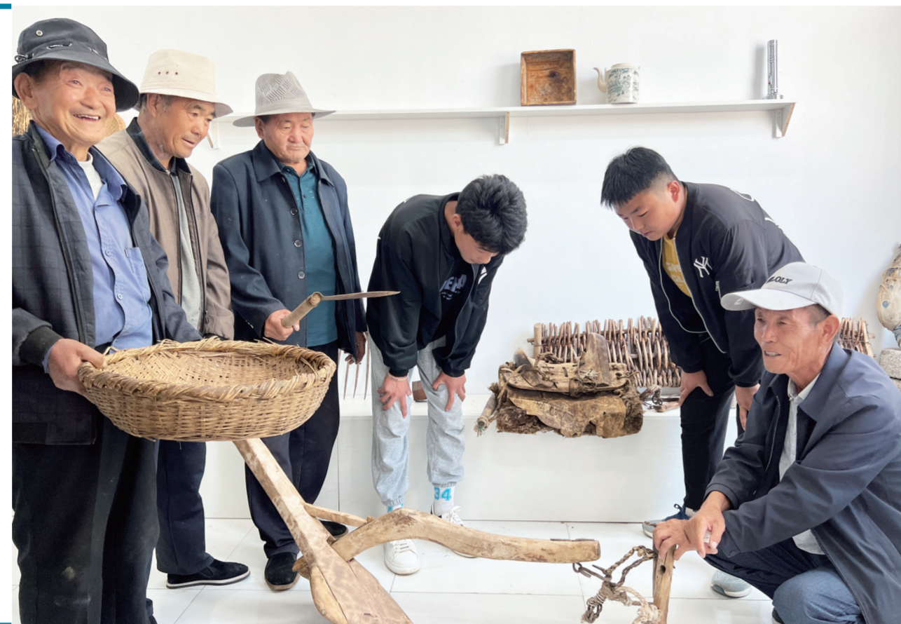
一方故土地,蕴含着厚重的历史沉淀;一个老物件,讲述着时代的历史文明。近年来,海东市化隆回族自治县二塘乡在着力打造万亩绿色青稞产业的同时,充分发挥优势资源,挖掘农耕文化元素,既唤醒了记忆又留住了乡愁,把文化注入了农业,促进农文旅产业融合发展。图为二塘乡二村村民正在参观农耕工具。