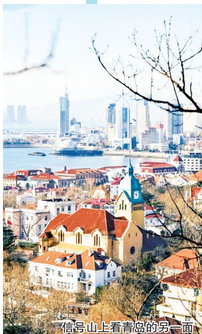
信号山上看青岛的另一面

毕业旅行能选择的城市、线路非常多,比如:川西、新疆都值得去。