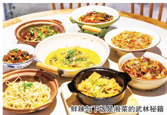
鲜辣与下饭是湘菜的武林秘籍