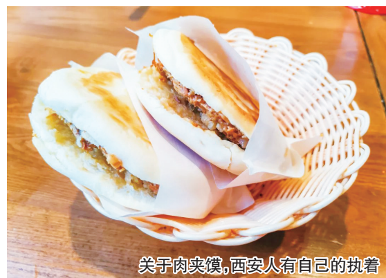
关于肉夹馍,西安人有自己的执着

对于喜欢人文历史和美食的学生来说,西安绝对是双厨狂喜的首选。不用花多少钱,就能让你“吃撑了兜着走”。这,就是西安的待客之道。