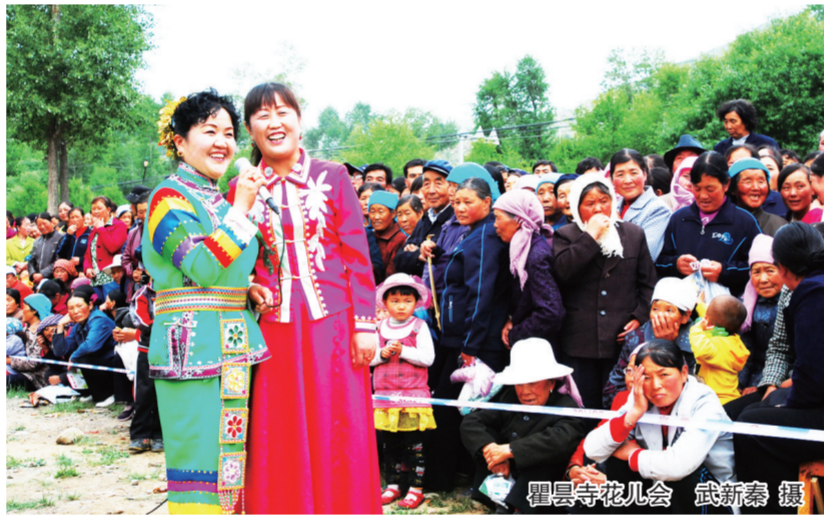
瞿昙寺花儿会