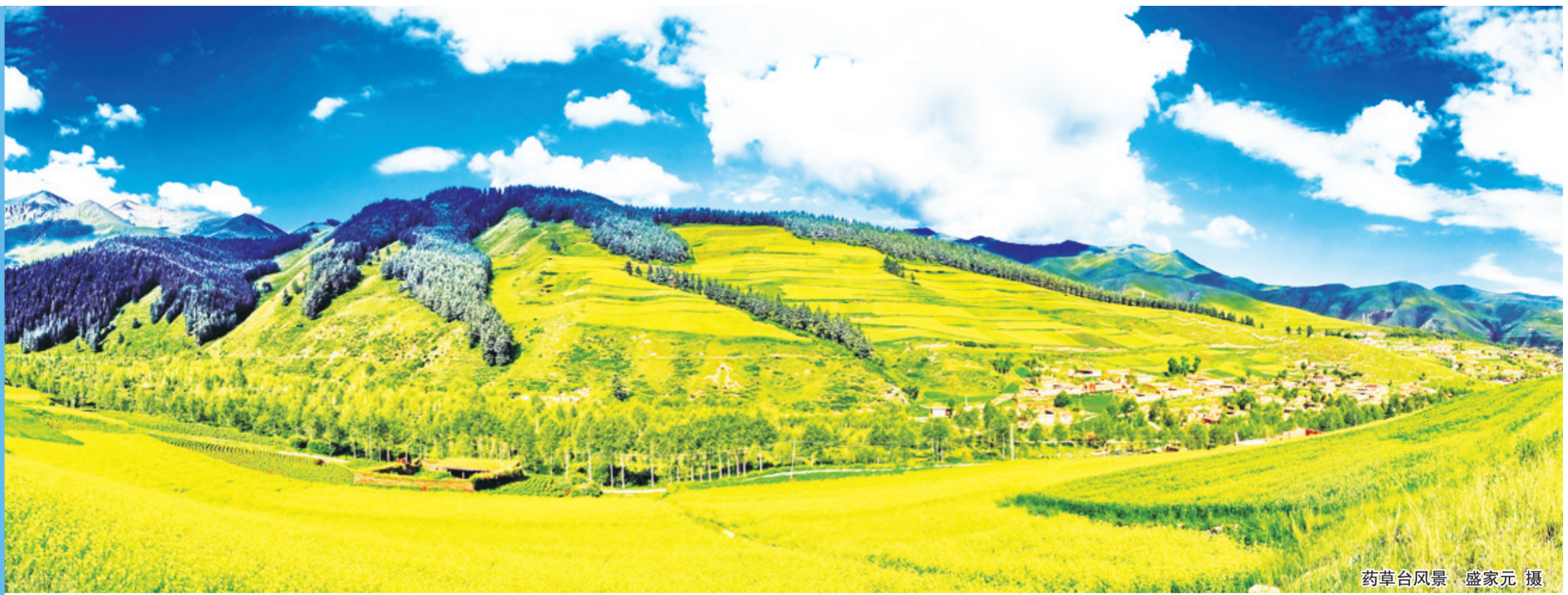
药草台风景