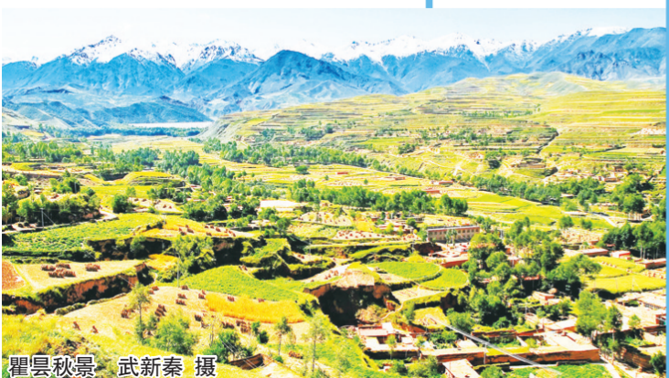
瞿昙秋景

壁画是瞿昙寺的主要珍品,时代之早、数量之多、艺术之精,驰名中外。从金刚殿起,经大小钟鼓楼、隆国殿两旁共有51间壁画廊,布满彩色壁画。这些壁画以丰富的色彩、连环画的方式,画出了释迦牟尼一生的故事。构思巧妙,驰骋想象,贯通三界,纵横太空,画面上的山石林木、文臣武将、神佛菩萨、六王之土、龙凤神像,个个活灵活现,形神兼备,用笔细腻流畅,色彩淡雅清新,富有浓厚的生活气息,技法之纯熟,形象之生动,达到高超的境界。