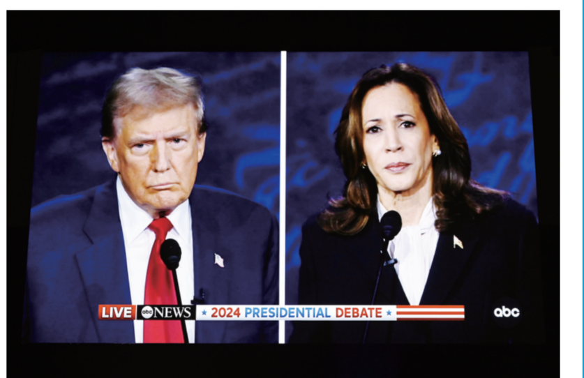
这张9月10日在美国费城总统辩论媒体中心拍摄的视频直播画面显示,美国民主党总统候选人、副总统哈里斯(右)与共和党总统候选人、前总统特朗普在费城参加电视辩论。

卫星通讯社11日援引美国芝加哥大学政治学教授约翰·米尔斯海默的话报道,战场形势正有利于俄罗斯的方向发展。乌克兰或在某个时候承认“松绑”对乌克兰武器使用限制的官员将以胜利者身份出现在谈判桌前”。(新华社专特稿)