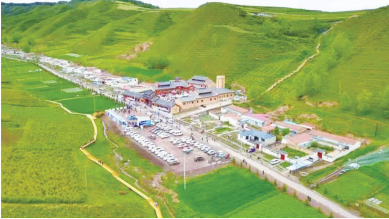
磨尔沟俯瞰